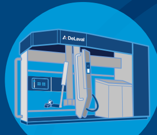
DeLaval Serie VMS™

Las nodrizas para terneras DeLaval son perfectas trabajando con: